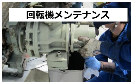
回転機メンテナンス