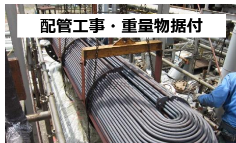
配管工事・重量物据付